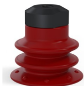
Referência da variação: 96 25SL FM5