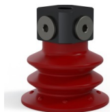
Riferimento variante: 96 52SL 18D-3-BD