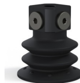
Riferimento variante: 96 52NI 18D-3-BD