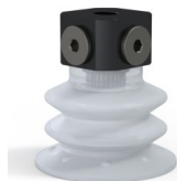
Riferimento variante: 96 52SLT 18D-3-BD