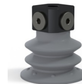
Riferimento variante: 96 52NR 18D-3-BD