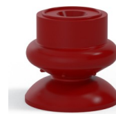
Riferimento variante: 80A 25SL A SH30