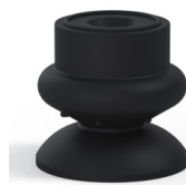
Riferimento variante: 80A 25NI A