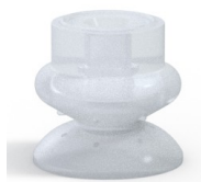
Riferimento variante: 80A 25SLT A