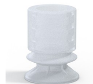
Riferimento variante: 8 16SLT A