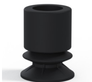
Riferimento variante: 8 16NI A