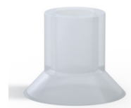
Riferimento variante: 75 20SLT A