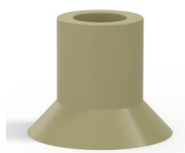
Riferimento variante: 75 20CN A