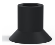
Riferimento variante: 75 20NI A