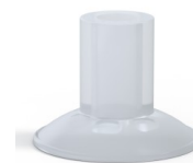
Riferimento variante: 7 26SLT A