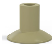
Riferimento variante: 7 26CN A