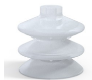
Riferimento variante: 2 87SLT A