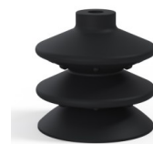
Riferimento variante: 2 87NI A