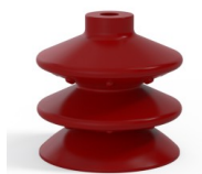
Riferimento variante: 2 87SL A