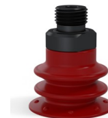
Riferimento variante: 96 25SL M18D-4-F