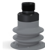
Riferimento variante: 96 25NR M18D-4-F