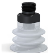
Riferimento variante: 96 25SLT M18D-4-F