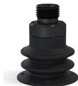
Riferimento variante: 96 25NI M18D-4-F