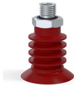
Référence déclinaison : 95 40SL O