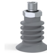
Référence déclinaison : 95 40NR O