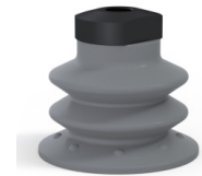
Référence déclinaison : 96 52NR 18D-2-F