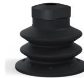
Référence déclinaison : 96 52NI 18D-2-F