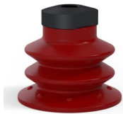
Référence déclinaison : 96 52SL 18D-2-F