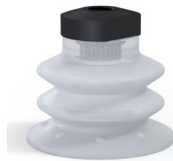
Référence déclinaison : 96 52SLT 18D-2-F