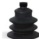
Référence déclinaison : 96 52NI 14D-2-F