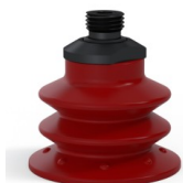
Référence déclinaison : 96 52SL 14D-2-F