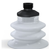
Référence déclinaison : 96 52SLT 14D-2-F