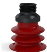
Référence déclinaison : 96 35SL 38D-2-GIC