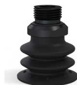
Référence déclinaison : 96 35NI 38D-2-GIC