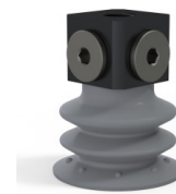
Référence déclinaison : 96 35NR 18D-3-BD