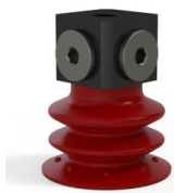
Référence déclinaison : 96 35SL 18D-3-BD