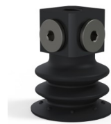
Référence déclinaison : 96 35NI 18D-3-BD