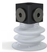
Référence déclinaison : 96 35SLT 18D-3-BD