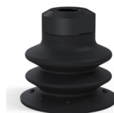
Référence déclinaison : 96 35NI 18D-2-GIC