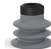
Référence déclinaison : 96 35NR 18D-2-GIC