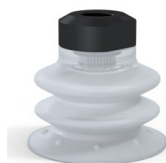
Référence déclinaison : 96 35SLT 18D-2-GIC