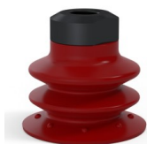
Référence déclinaison : 96 35SL 18D-2-GIC