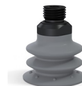
Référence déclinaison : 96 35NR 14D-2-GIC