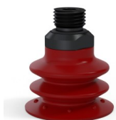
Référence déclinaison : 96 35SL 14D-2-GIC