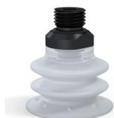
Référence déclinaison : 96 35SLT 14D-2-GIC