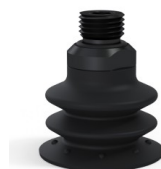
Référence déclinaison : 96 35NI 14D-2-GIC