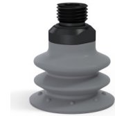
Référence déclinaison : 96 35NR 14D-2