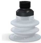
Référence déclinaison : 96 35SLT 14D-2