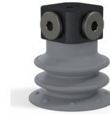
Référence déclinaison : 96 25NR FM5BD