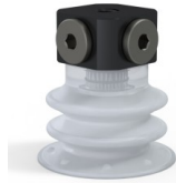
Référence déclinaison : 96 25SLT FM5BD