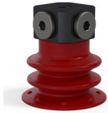
Référence déclinaison : 96 25SL FM5BD