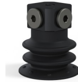
Référence déclinaison : 96 25NI FM5BD