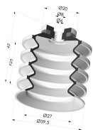
Ventouse 4.5 Soufflets Série 92 Ø 40MM