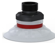
Référence déclinaison : 90 50SLT 38D-2