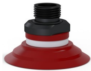
Référence déclinaison : 90 50SL 38D-2