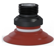
Référence déclinaison : 90 40SL 38D-2-GIC