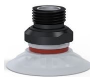
Référence déclinaison : 90 40SLT 38D-2-GIC