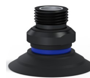
Référence déclinaison : 90 40NI 38D-2-GIC