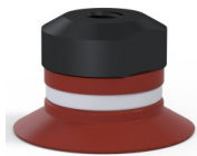
Référence déclinaison : 90 20SL FM5