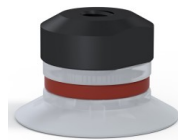
Référence déclinaison : 90 20SLT FM5