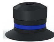
Référence déclinaison : 90 20NI FM5