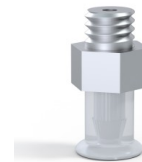
Référence déclinaison : 9 07SLT M5M