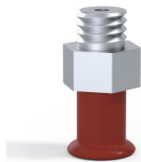
Référence déclinaison : 9 07SL M5M