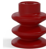
Référence déclinaison : 80A 30SL A