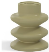
Référence déclinaison : 80A 30CN A