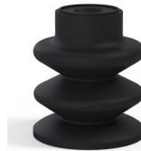
Référence déclinaison : 80A 30NI A