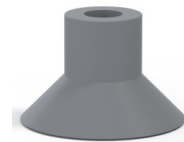
Référence déclinaison : 78 30NR A