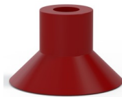
Référence déclinaison : 78 30SL/RV A