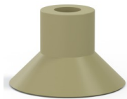
Référence déclinaison : 78 30CN A