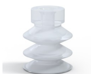
Référence déclinaison : 21 18SLT A