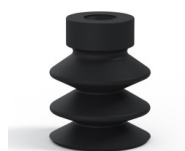
Référence déclinaison : 21 18NI A