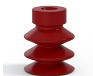
Référence déclinaison : 21 18SL A