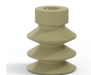
Référence déclinaison : 21 18CN A