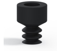
Référence déclinaison : 21 05NI A