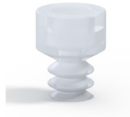
Référence déclinaison : 21 05SLT A