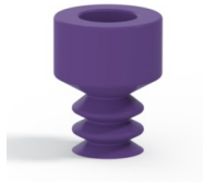
Référence déclinaison : 21 05MNT A