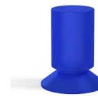
Référence déclinaison : 76 17VI A