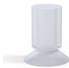
Référence déclinaison : 76 17SLT A SH40