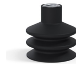
Référence déclinaison : 8B 50NI F14