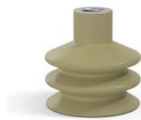
Référence déclinaison : 8B 50CN F14