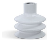
Référence déclinaison : 8B 50SLT F14