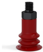
Referencia de la variante: 96 15SL M5