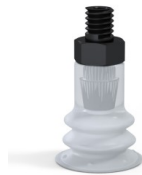
Referencia de la variante: 96 15SLT M5