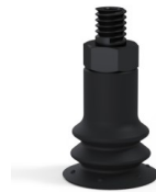
Referencia de la variante: 96 15NI M5