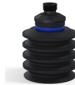
Referencia de la variante: 92 50NI 14D-2-F