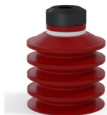
Referencia de la variante: 92 40SL 18D-2-GIC