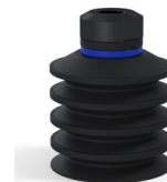
Referencia de la variante: 92 40NI 18D-2-GIC