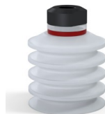
Referencia de la variante: 92 40SLT 18D-2-GIC