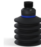
Referencia de la variante: 92 40NI 14D-2-GIC