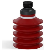
Referencia de la variante: 92 40SL 14D-2-GIC