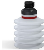
Referencia de la variante: 92 40SLT 14D-2-GIC