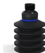
Referencia de la variante: 92 40NI 14D-2