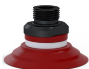
Referencia de la variante: 90 50SL 38D-2-GIC