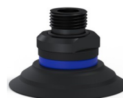
Referencia de la variante: 90 50NI 38D-2-GIC