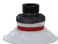
Referencia de la variante: 90 50SLT 38D-2-GIC