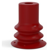
Referencia de la variante: 96 15SL A