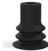
Referencia de la variante: 96 15NI A