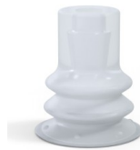
Referencia de la variante: 96 15SLT A