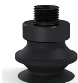
Referencia de la variante: 91 20NI M18