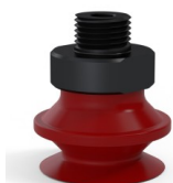
Referencia de la variante: 91 20SL M18