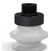
Referencia de la variante: 91 20TPU M18