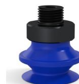
Referencia de la variante: 91 20PU M18