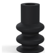
Referencia de la variante: 8B 30NI A • Color: Negro • Materiales: Nitrilo