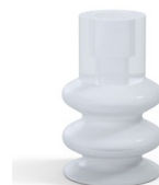
Referencia de la variante: 8B 30SLT A • Color: Translúcido • Materiales: Silicona