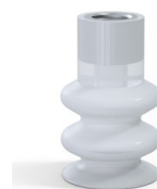
Referencia de la variante: 8B 30SLT F14 • Color: Translúcido • Materiales: Silicona