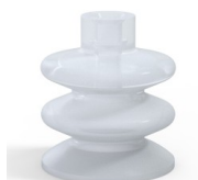
Referencia de la variante: 80A 40SLT A