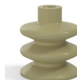
Referencia de la variante: 80A 40CN A