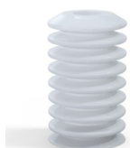
Referencia de la variante: 81 40SLT A