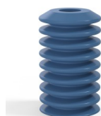
Referencia de la variante: 81 40SLBLEU A