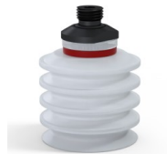
Variantenreferenz: 92 50SLT 14D-2-F