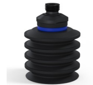
Variantenreferenz: 92 50NI 14D-2-F