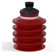
Variantenreferenz: 92 50SL 14D-2-F