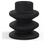
Variantenreferenz: 80A 30NI A