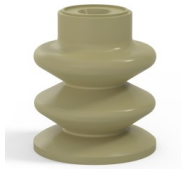
Variantenreferenz: 80A 30CN A