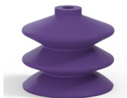
Variantenreferenz: 2 61MNT A