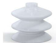
Variantenreferenz: 2 61SLT A