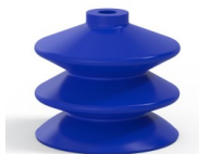
Variantenreferenz: 2 61PU A