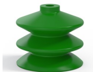
Variantenreferenz: 2 61SLV A