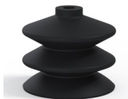
Variantenreferenz: 2 61NI A