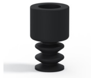
Variantenreferenz: 2 07NI A