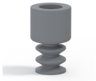
Variantenreferenz: 2 07NR A