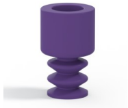
Variantenreferenz: 2 07MNT A