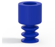
Variantenreferenz: 2 07PU A