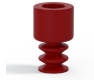
Variantenreferenz: 2 07SL A