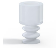
Variantenreferenz: 2 07SLT A