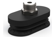
Variantenreferenz: 4R 62NI M38