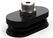
Variantenreferenz: 4R 62NR M38